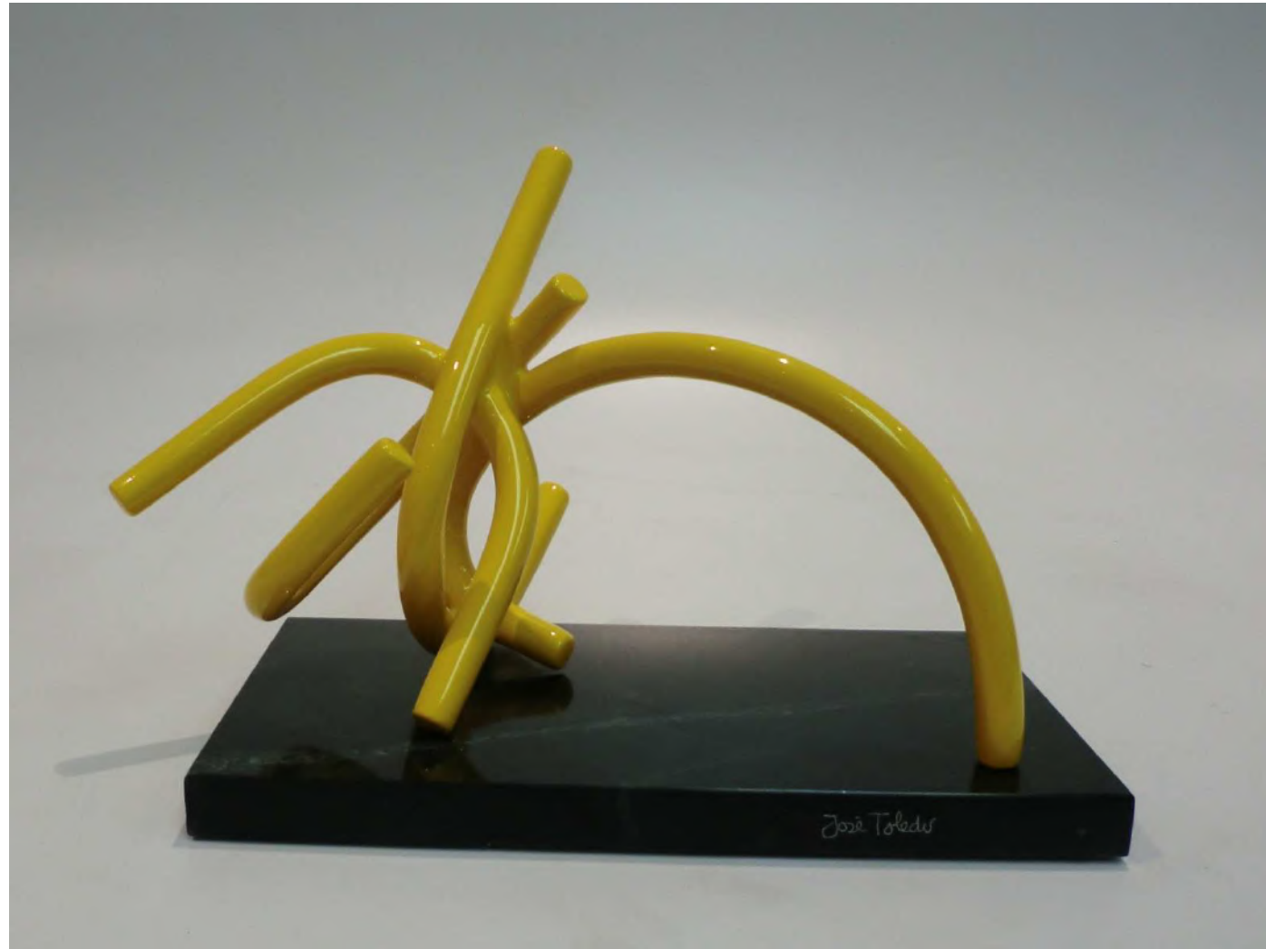
Nudo neurológico al final del arco iris