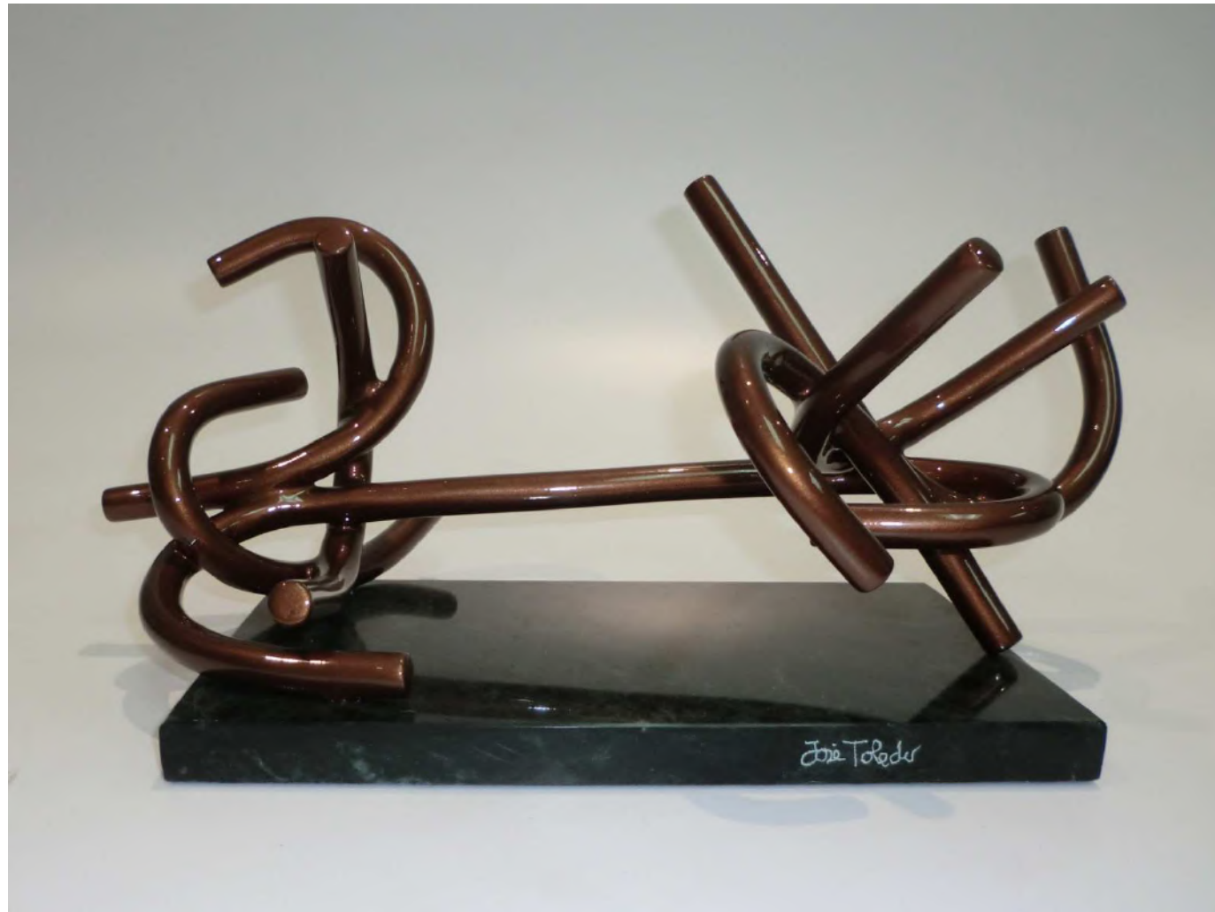
El principio y el fin