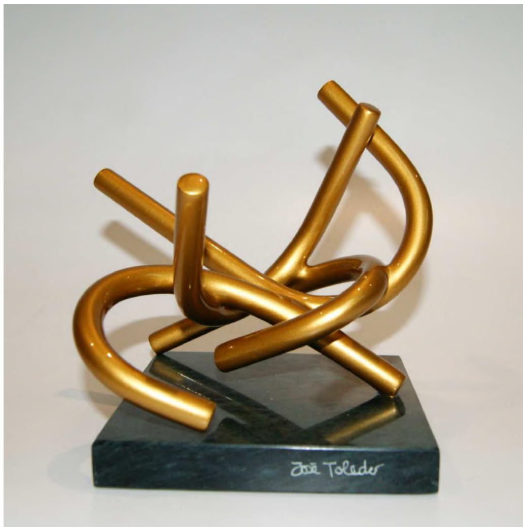
Sentimiento de lo que transcurre