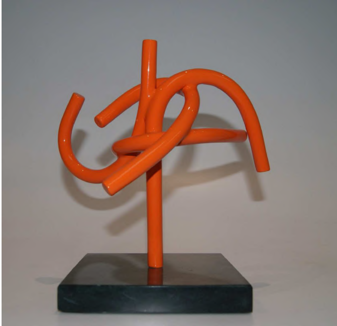
Danzando don el tiempo