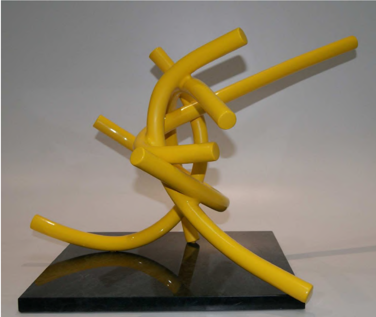
Señal de peligro