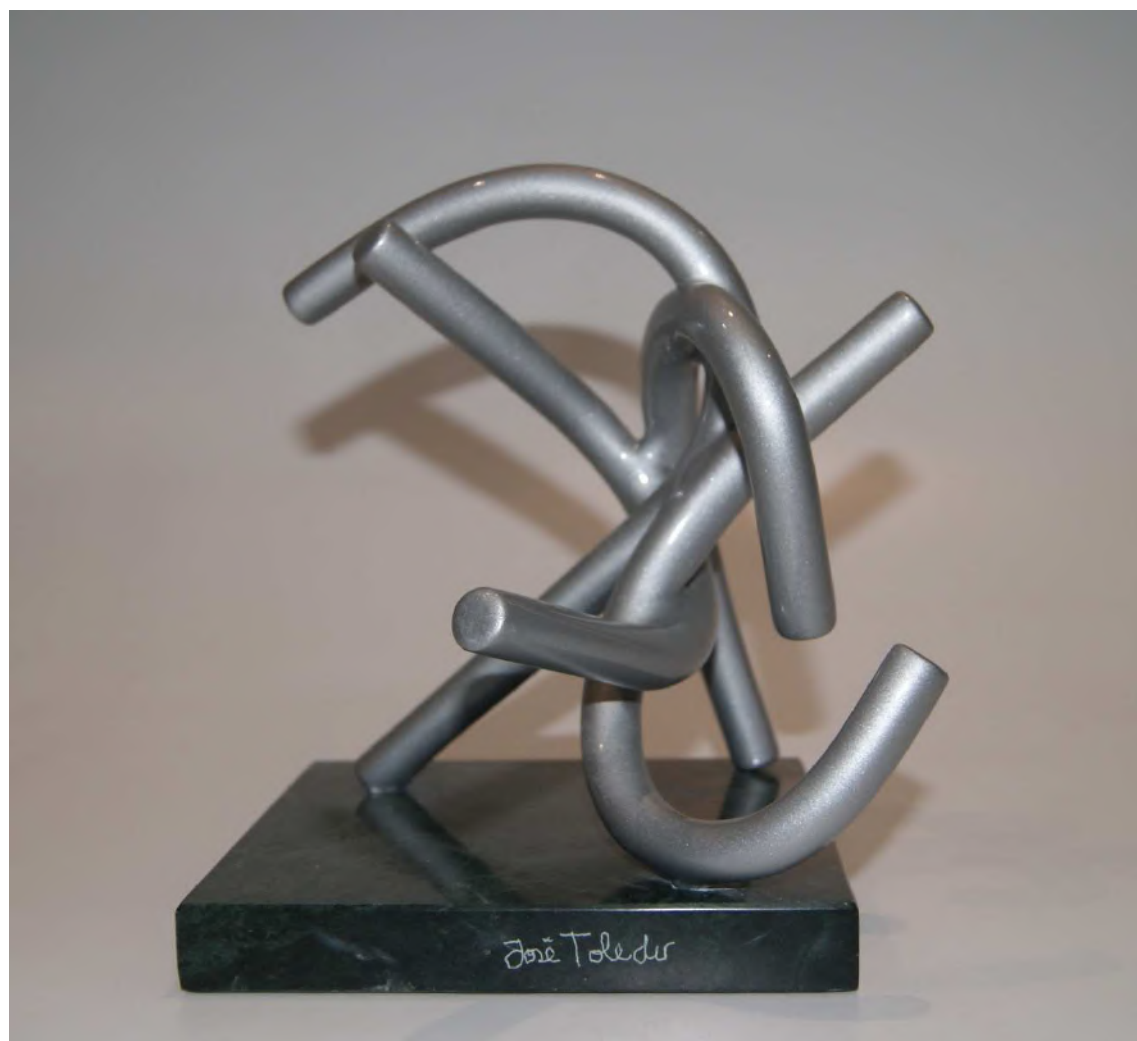
Gladiador luchando con el tiempo