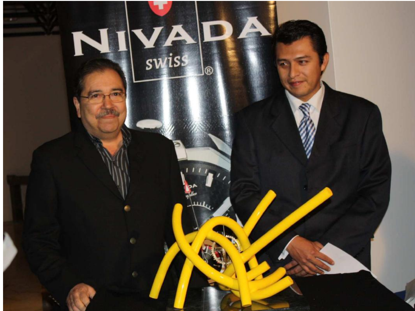
Entrega de la obra “El tiempo está loco” a la colección “La Sala del tiempo” de Nivada Swiss