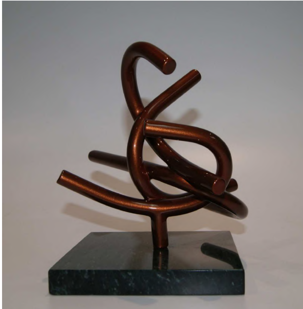
Cisne que transcurre