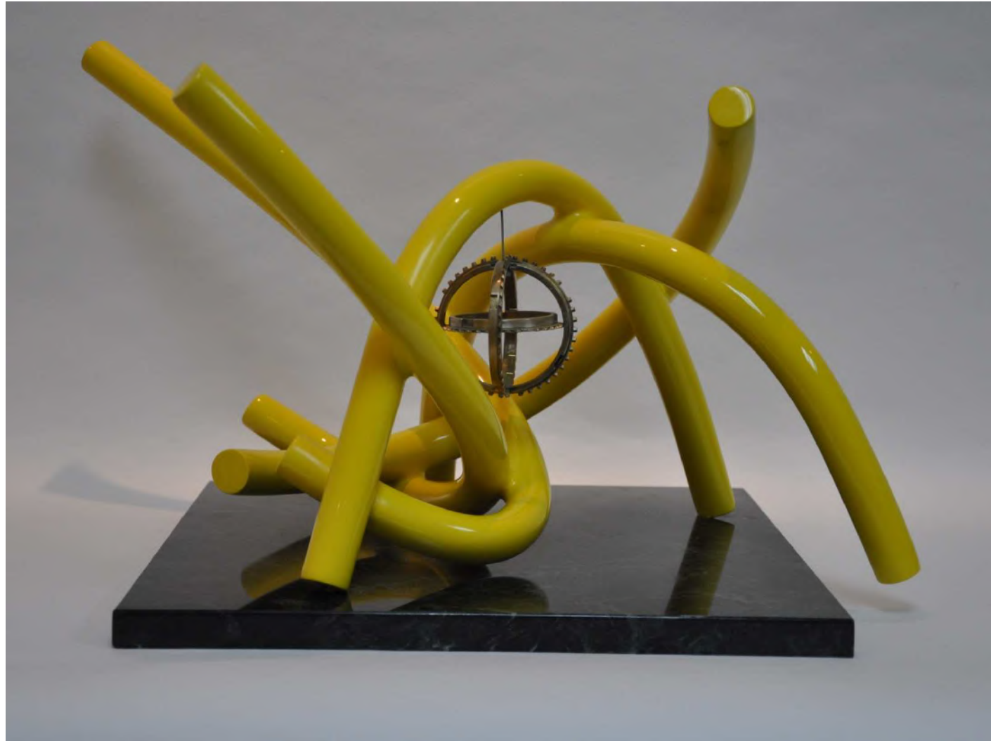
El tiempo está loco