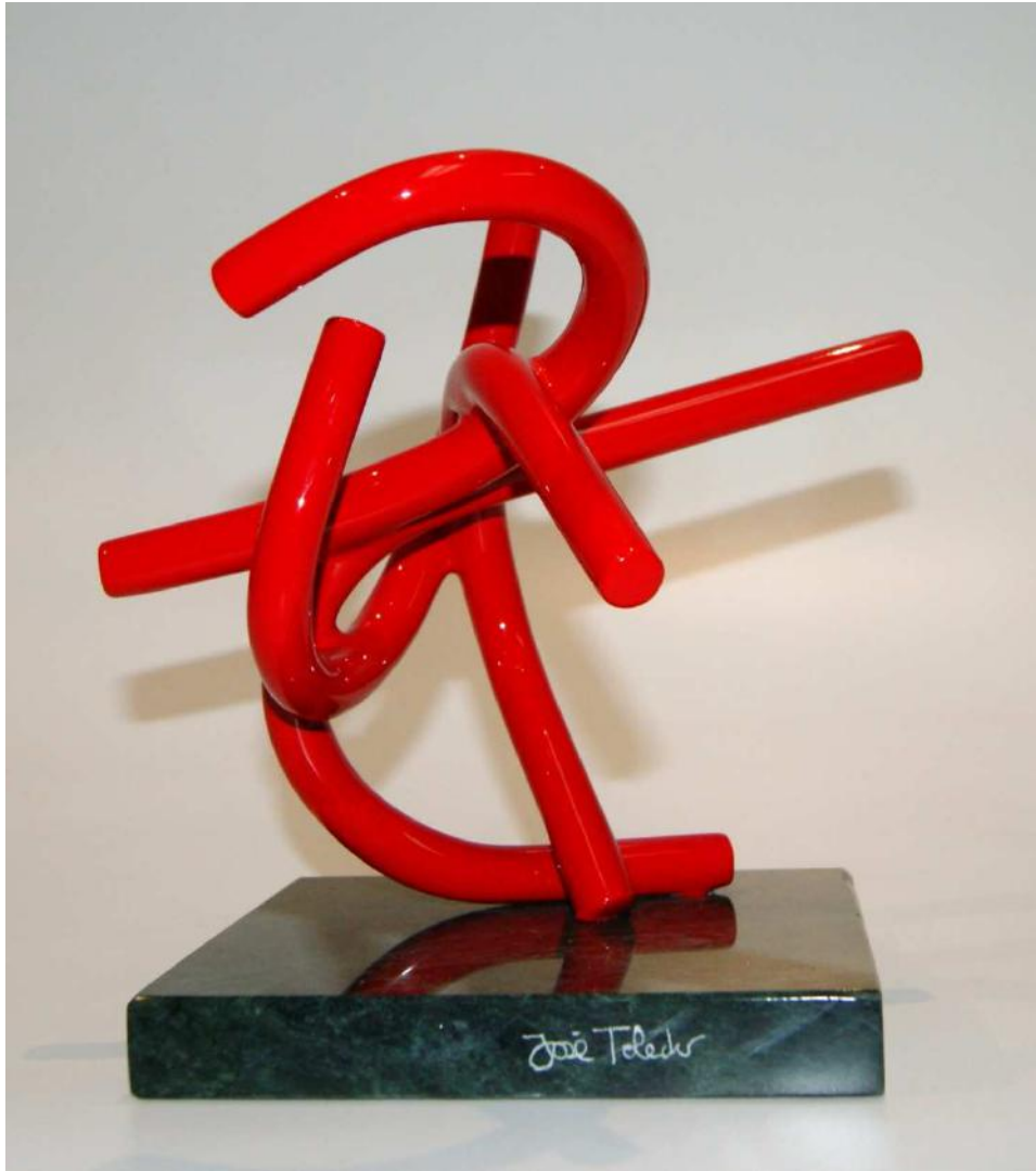
Ángel de las ideas fugitivas