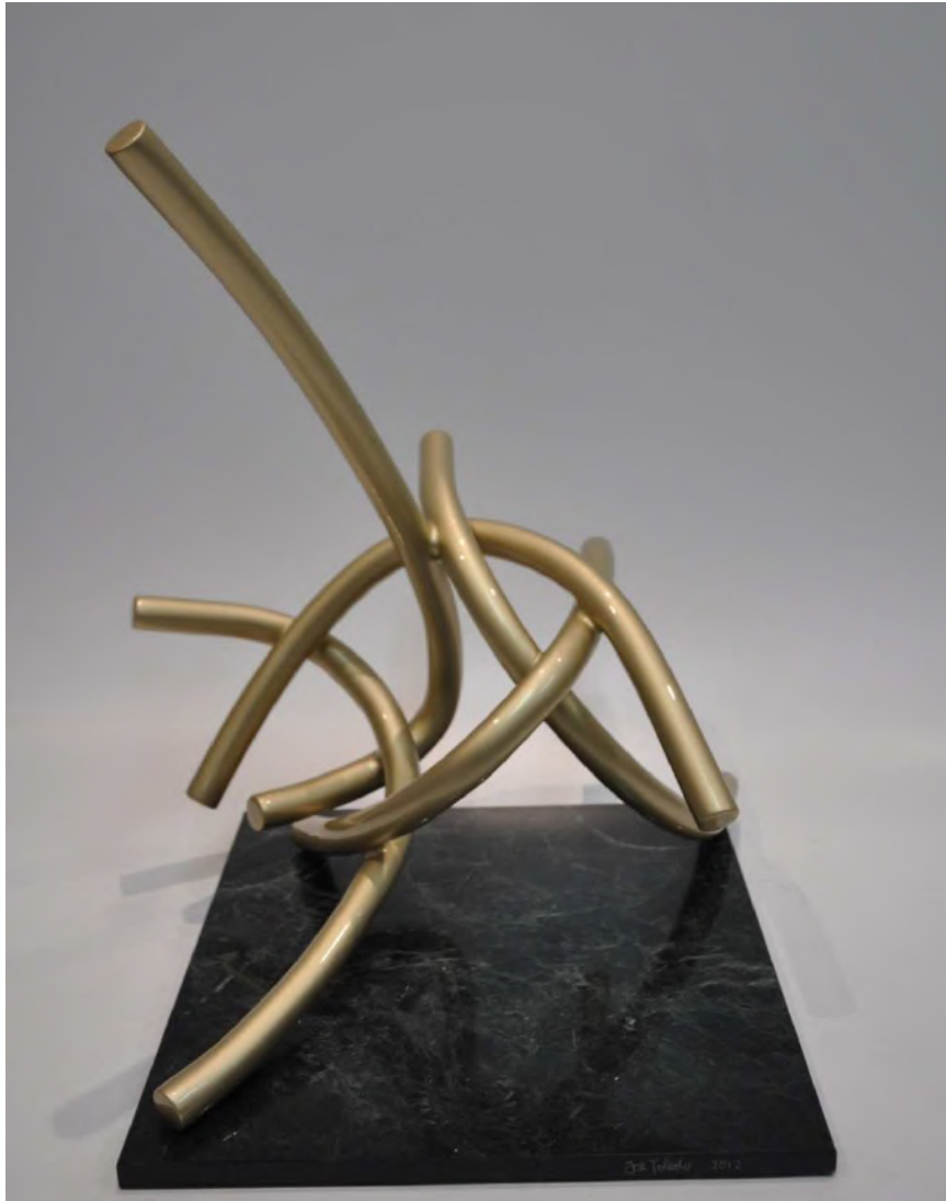
Inquietud permanente herida con lejanía