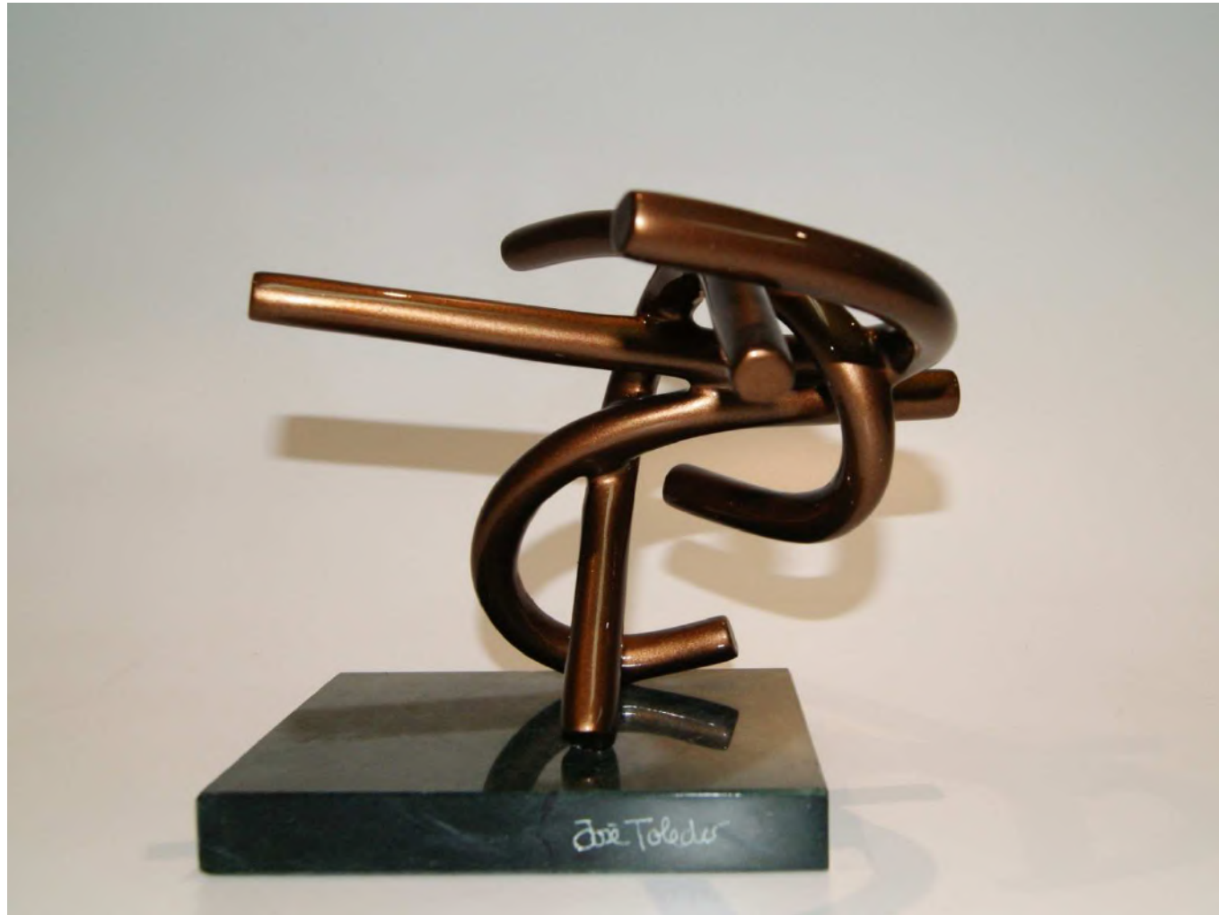
Angustia por el tiempo que nos atormenta