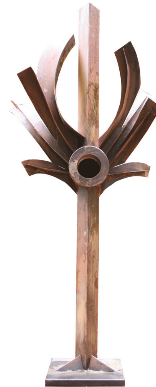
Arbre aux idées explosées, 2010 Tôle soudée, 300 x 122 x 92 cm.