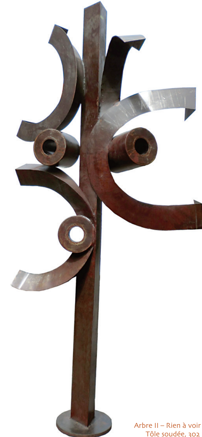
Arbre II - Rien à voir avec ça, 2010 Tôle soudée, 302 x 154 x 77 cm.