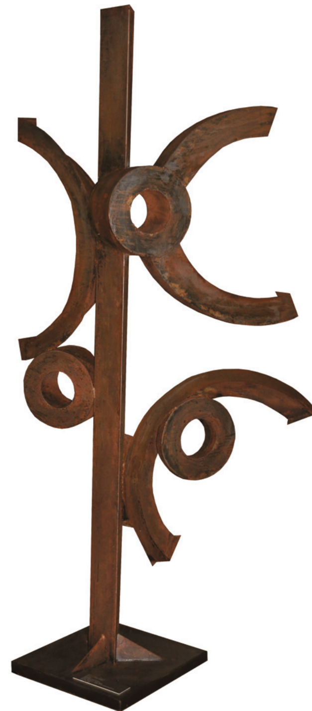
Arbre I - Rien à voir avec ça, 2010 Tôle soudée, 325 x 127 x 64 cm.