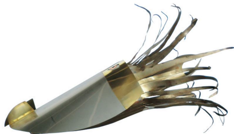
Kraken II, 2010 Feuilles d'acier inoxydable, fer, cuivre et laiton cloués, soudés et collés avec des pièces d'automobile, 105 x 75 x 105 cm.