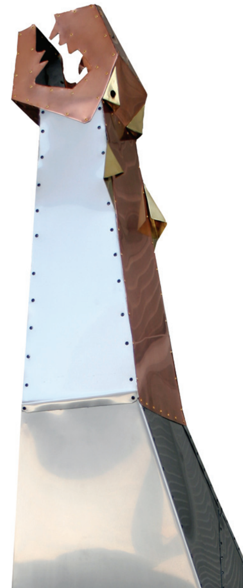
Le cri, détail