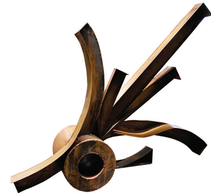
Buisson canon, 2010 Tôle soudée, 120,5 x 150 x 41 cm.

Alain Rouquié, président de la Maison de l'Amérique latine Marco Tulio Chicas Sosa, ambassadeur du Guatemala en France