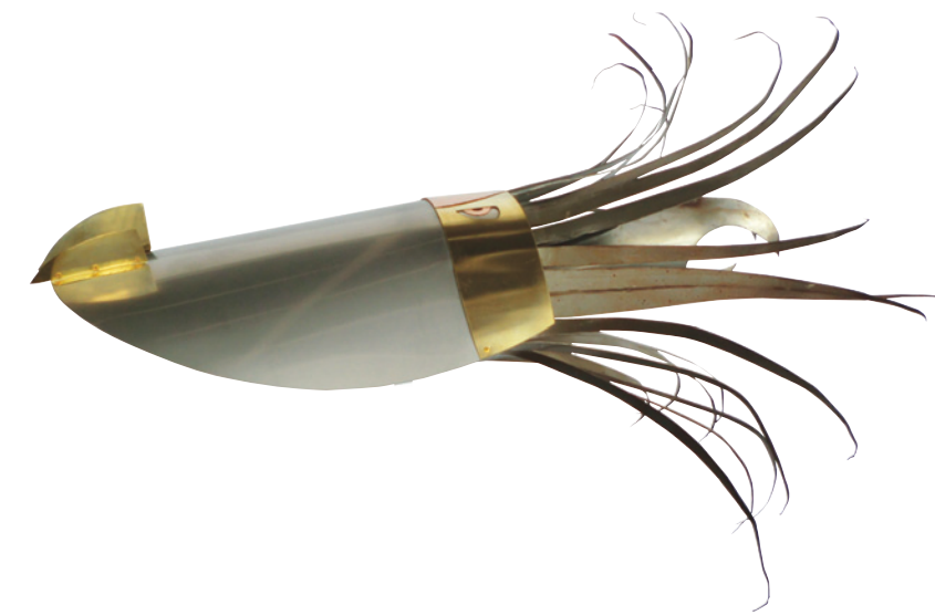
Kraken I, 2010 Feuilles d'acier inoxydable, fer, cuivre et laiton cloués, soudés et collés avec des pièces d'automobile, 115 x 83 x 153 cm.