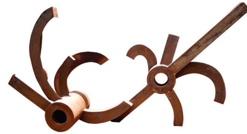
Buissons se rendant intéressants, 2010 Tôle soudée, 134 x 243 x 61 cm.