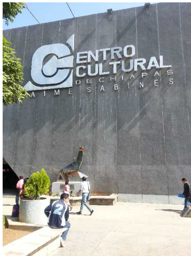
Centro Cultural Jaime Sabines

Así que a partir de este martes 20 de noviembre, la Galería de Arte Contemporáneo de Chiapas se encuentra abierta al público en general en un horario de 9:00 a 19:00 horas. Asista y conozca parte del acervo plástico que conforma la historia artística de Chiapas.