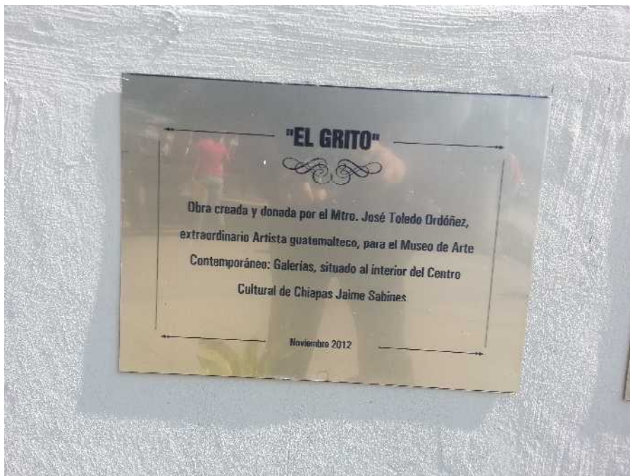
Placa de agradecimiento